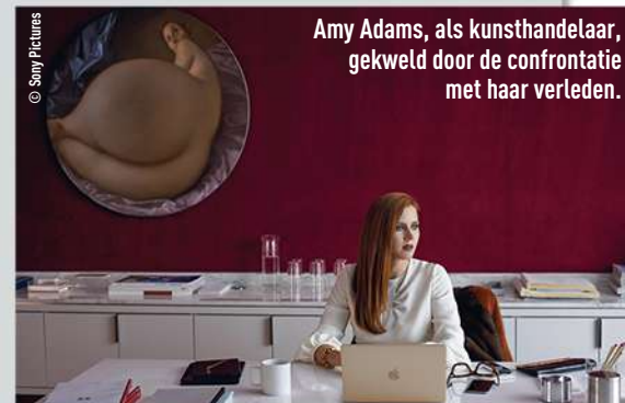
Amy Adams, als kunsthandelaar, gekweld door de confrontatie met haar verleden.

Dit immens intense liefdesverhaal zit ingekapseld in een neofilm noir en switcht meermaals tussen redneck terrein en een arty setting. "Susan, enjoy the absurdity of our world. It's a lot less painful. Believe me, our world is a lot less painful than the real world", zegt een kunstenaar bij het begin van de film, wat niet veel later pijnlijk bewaarheid wordt in de film.