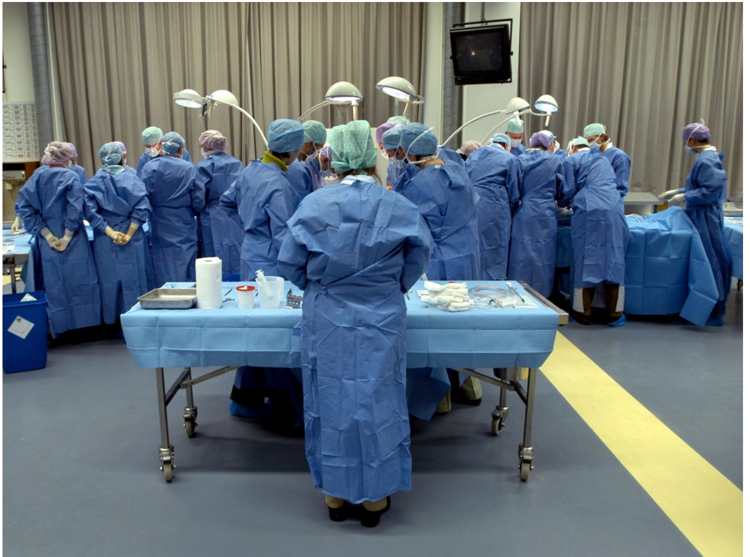
Chirurgen oefenen om een multiorgaantransplantatie uit te voeren.

In Nederland zijn tussen 2012 en 2017 46 keer organen getransplanteerd na euthanasie. In België gebeurde dat 35 keer tussen 2005 en